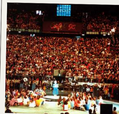
Stadio Palaeur Roma (1990)