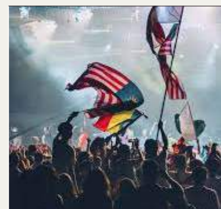
56 Genfest nazionali in tutto il mondo (1993)