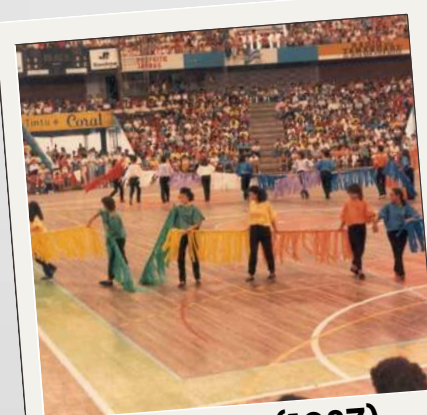
Genfest (1987) in 40 paesi diversi