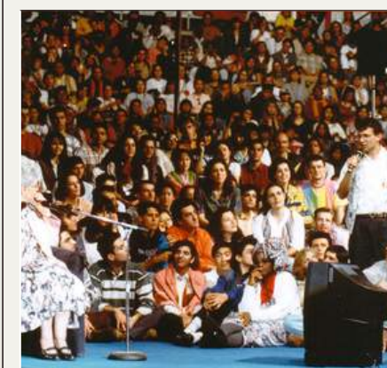
Stadio Palaeur Roma (1995)