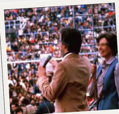
Stadio Flaminio Roma (1980)