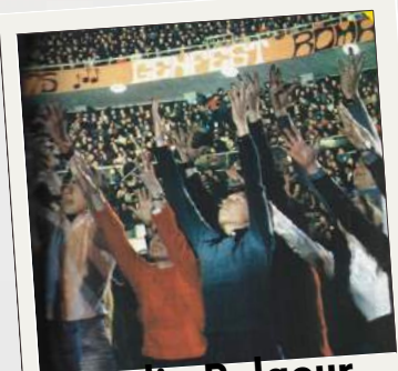
Stadio Palaeur Roma (1975)