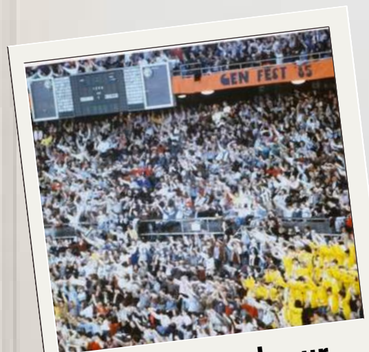
Stadio Palaeur Roma (1985)