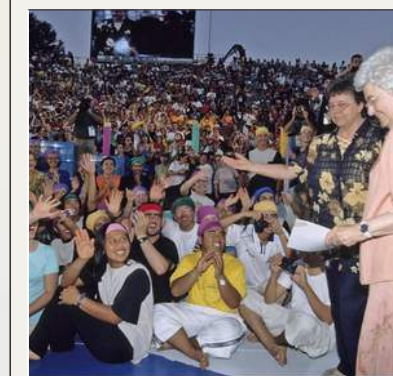
Stadio Flaminio Roma (2000)