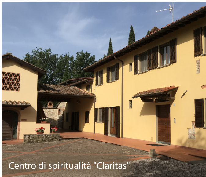
Centro di spiritualità "Claritas"